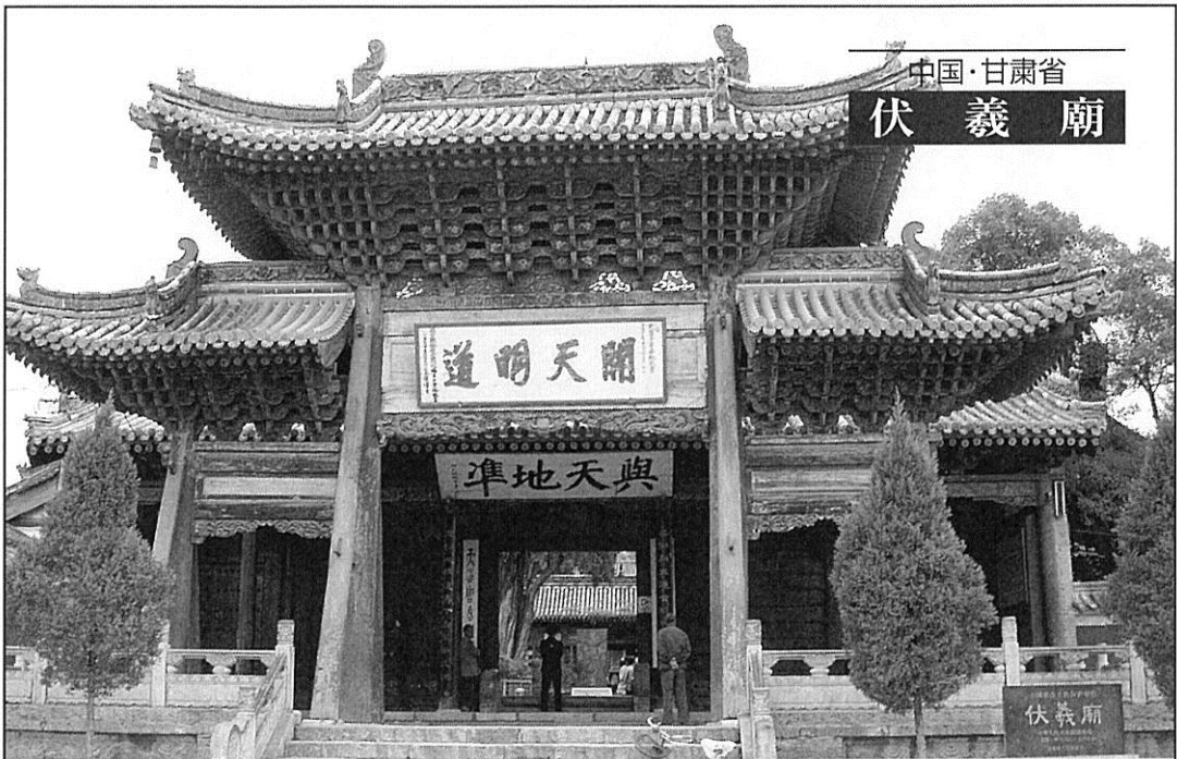
中国・甘肅省 伏羲廟

甘肅省天水市。天河の水が注ぎ込むとの伝説からその名が付いた。天水市には伏羲が生まれたとされる伏羲廟がある。伏羲は中国古来伝説の三皇五帝のうち神農・女媧とともに三皇の一人。文字や暦を作り、易学の元、八卦を発明したとされる。また、ここ天水地方は「半夏」の産地としても有名である。